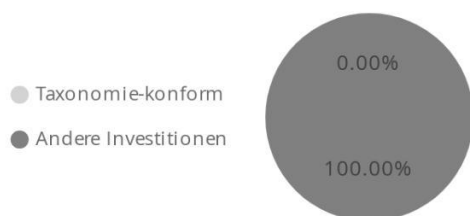
1. Taxonomie-Konformität der Investitionen einschließlich Staatsanleihen*